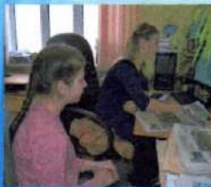
Работники и редакторы

С сентября 2017 года школьная газета выходит в стандартном газетном формате ежеквартальной толстухи. Верстается газета в период школьных каникул. В течение всей учебной четверти спецкеры собирают информацию, обсуждают и готовят её к публикации в школьной газете.