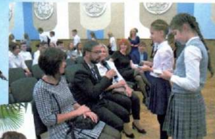
Интервью у педагогов из Чехии