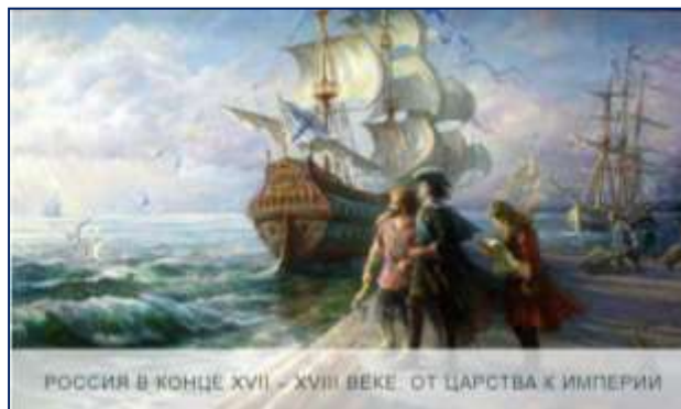
РОССИЯ В КОНЦЕ XVII – XVIII ВЕКЕ. ОТ ЦАРСТВА К ИМПЕРИИ