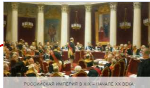
РОССИЙСКАЯ ИМПЕРИЯ В XIX – НАЧАЛЕ XX ВЕКА