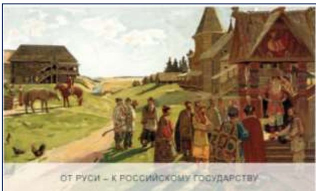
ОТ РУСИ – К РОССИЙСКОМУ ГОСУДАРСТВУ