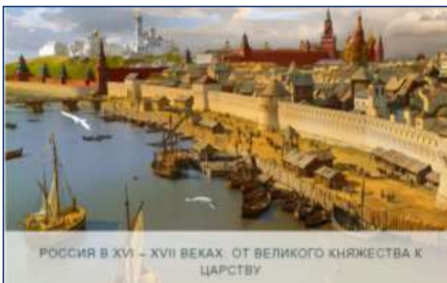
РОССИЯ В XVI – XVII ВЕКАХ. ОТ ВЕЛИКОГО КНЯЖЕСТВА К ЦАРСТВУ