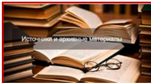
Источники и архивные материалы

Николаевское самодержавие: государственный консерватизм